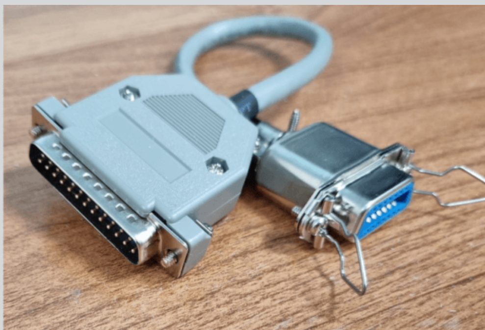
ОРИГИНАЛЬНЫЙ КАБЕЛЬ-ПЕРЕХОДНИК SATO ДЛЯ ПОДКЛЮЧЕНИЯ ВНЕШНИХ УСТРОЙСТВ (АППЛИКАТОРОВ) К РАЗЪЕМУ EXT ПРИВОДОВ ПЕЧАТЫ SATO. АРТИКУЛ WWS8N5050

При использовании релейного выхода внешнего устройства для запуска печати в